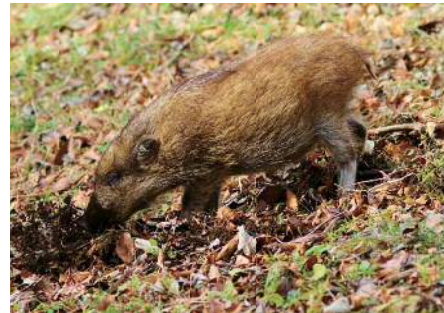
えさを探すウリ坊